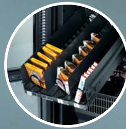
Leichtes Befüllen durch abklippbares Warenfach